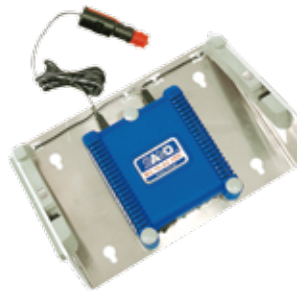
차량용 충전기 + 홀더