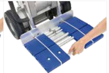
탈착식 돌리 B 535*345 mm