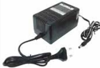
충전기 AC 220V