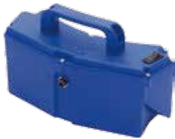
배터리(여분) DC 24V 5Ah