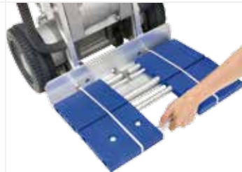
탈착식 돌리 A 464*345 mm