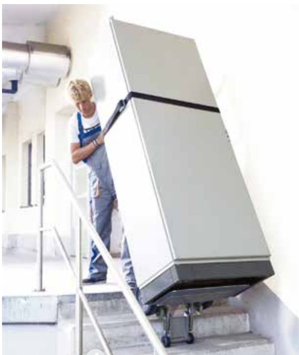
◀ 일반형 ▶