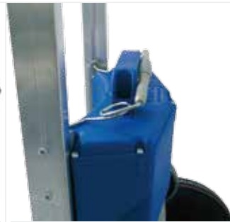
배터리 고정고리 배터리 빠짐 방지 고리